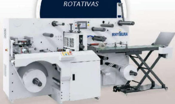
TROQUELADORAS SEMI / FULL ROTATIVAS