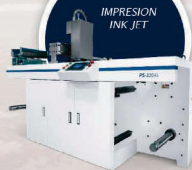
IMPRESION INK JET